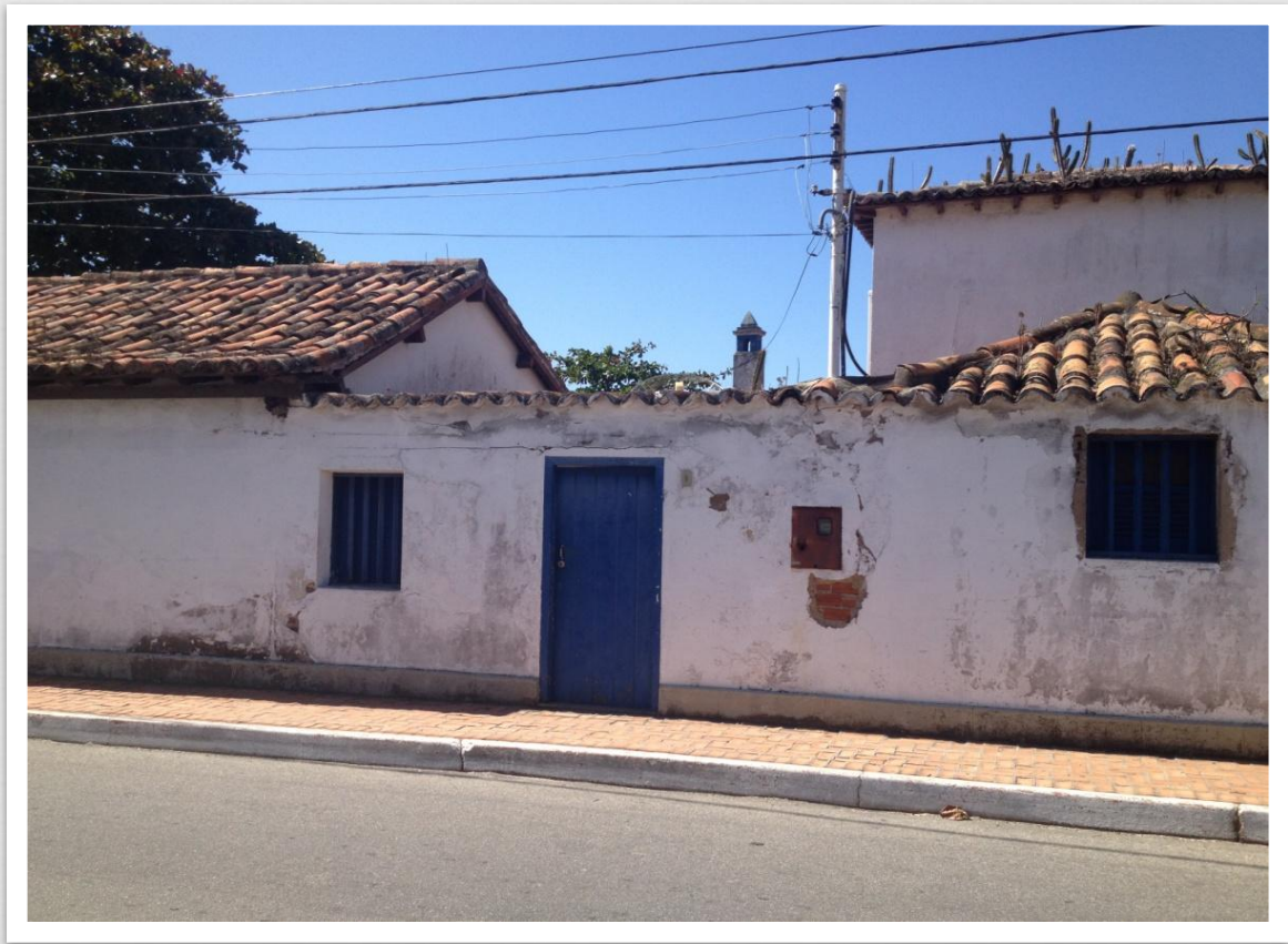
Casa da Piedra 25/09/14