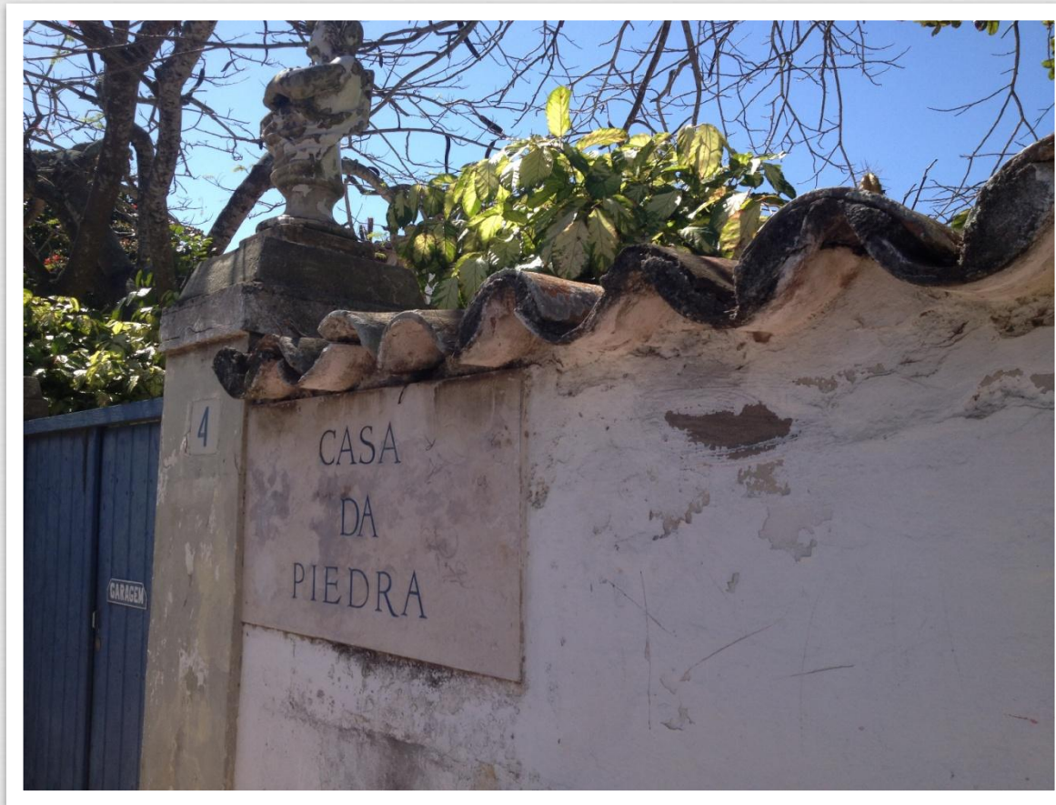
Casa da Piedra 25/09/14