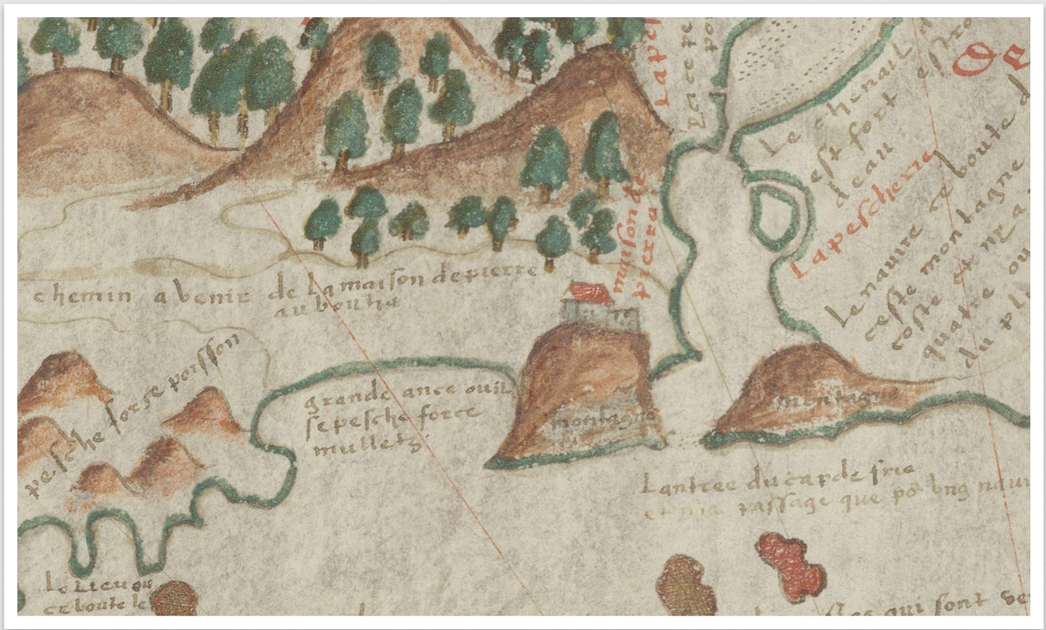
Le vrai pourtrait de Genevre et du Cap de Frie. Jacques de Vau de Claye. (1579)