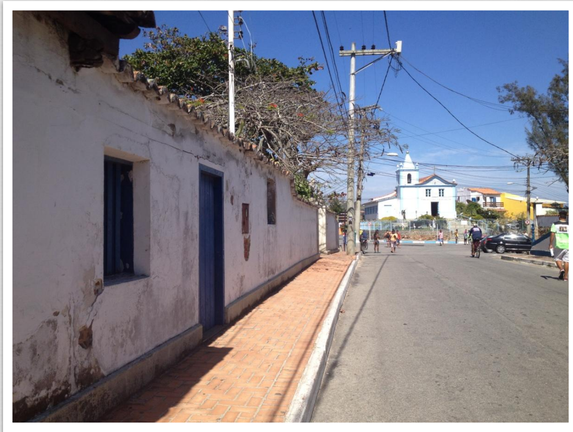
Casa da Piedra 25/09/14