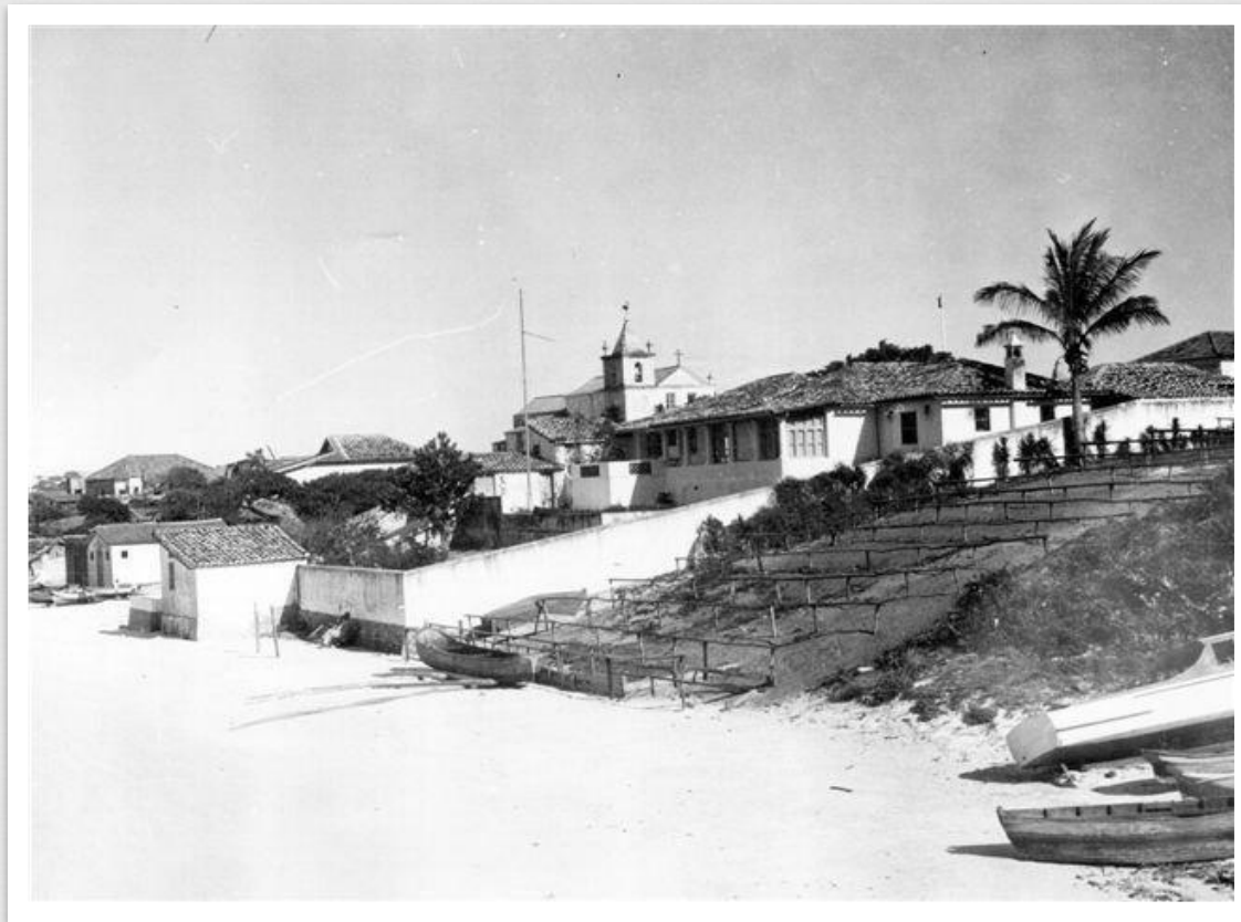
Casa da Piedra . Década de 60.