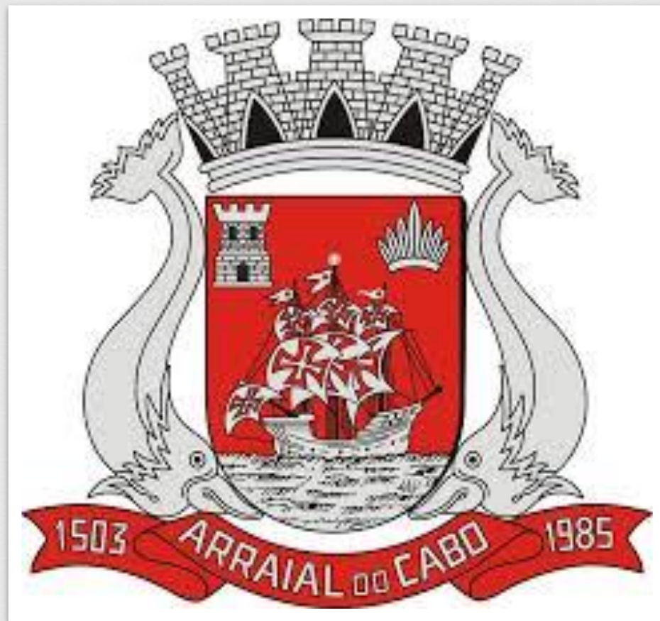
Brasão de Arraial do Cabo. Autoria: Dr. Lauro Ribeiro Escobar (1986)