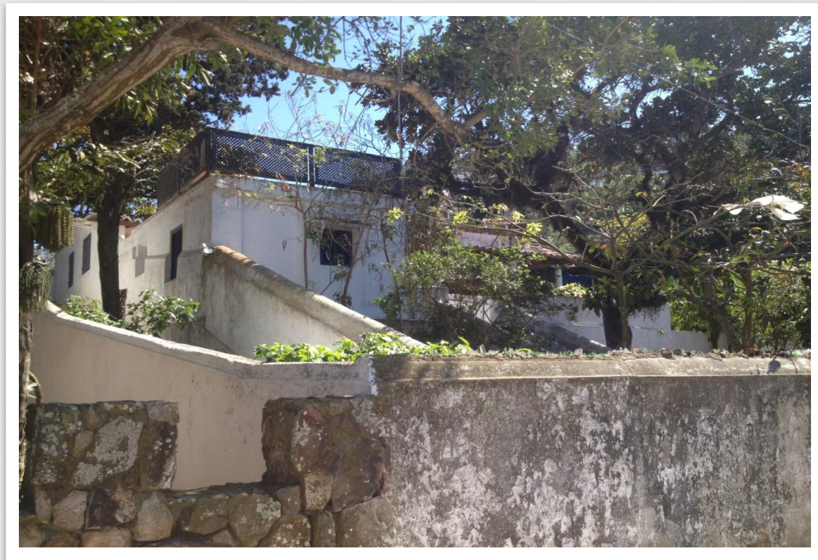
Casa da Piedra 25/09/14