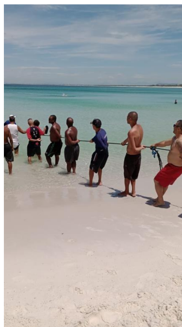
13 de janeiro de 2023 em mais um cerco da canoa “Timiro”.