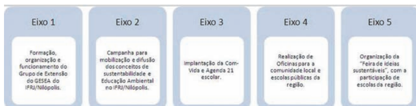
Figura 1 – Eixos do Programa de Extensão Sustenta-Ação

As etapas de trabalho do Programa Sustenta-Ação têm como base as diretrizes do Ministério do Meio Ambiente para a implementação da Agenda 21 Local e das diretrizes do MEC e MMA para formação da Com-Vida nas escolas; e as ações foram divididas em eixos descritos na Figura 1.