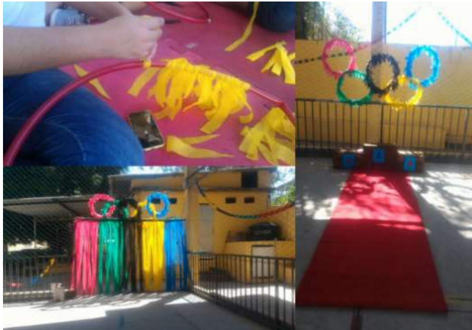
Figura 1 – Preparação do local

Os alunos começaram com os trabalhos manuais, colocando em prática as ideias de decoração que tiveram na fase do planejamento. O resultado deste trabalho pode ser visualizado no mix de imagens da figura a seguir.