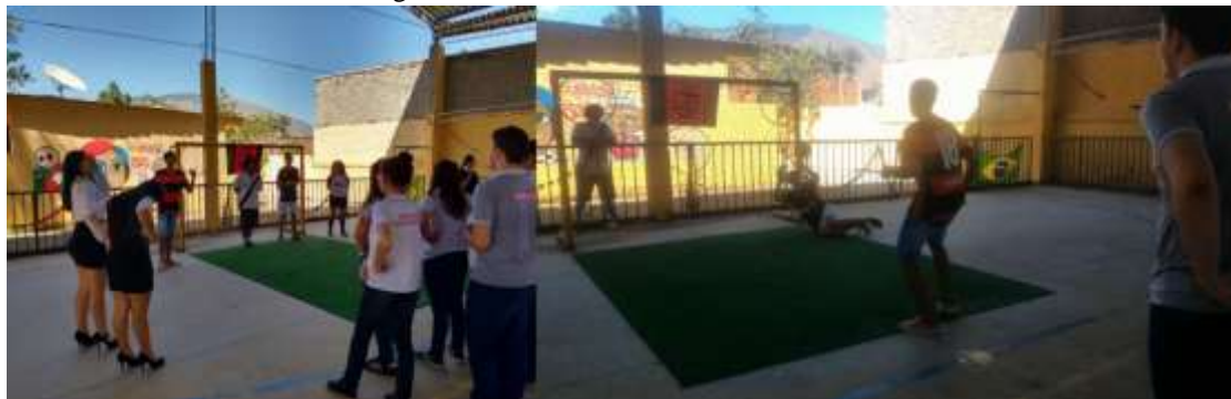
Figura 2 – Módulo Futebol e Processo seletivo