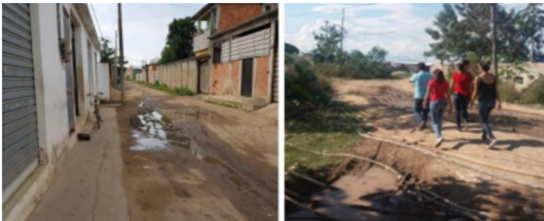
Figura 4. Localidade do Projeto Gramachinhos

( https://www.google.com.br/maps/place/Projeto+Gramachinhos/@-22.7496018,-43.2704709,16.5z/data=!4m5!3m4!1s0x9970eed1f9d8f7:0x270aeb7a29ea740a18m2!3d22.7519516!4d-43.2766391 )